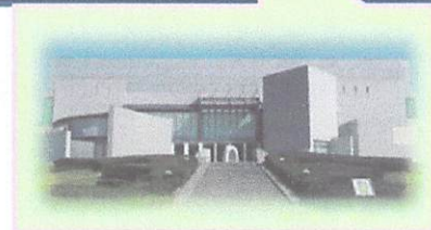
[会場]宮崎県立美術館