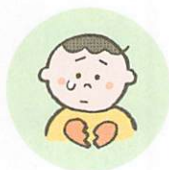
こどもの心や自尊心を傷つけるような言動をしたり、繰り返し言うこと