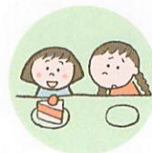
他のきょうだいとは著しく差別的な扱いをすること