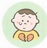
こどもの心や自尊心を傷つけるような言動をしたり、繰り返し言うこと