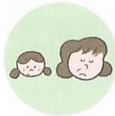
こどもを無視したり、拒否的な態度を示すこと