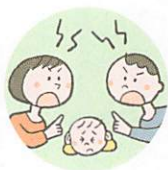
配偶者への暴力や暴言をこどもに見せること