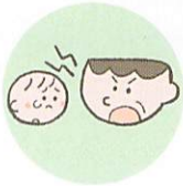
言葉で脅したり、脅迫すること

体罰は暴力でこどもの身体を傷つけるもので、心理的虐待は暴言などでこどもの心に深い傷を負わせるものです。こども本人への暴言でなくとも、配偶者や家族に対する強い言葉などもこどもの心を傷つけ、発達に影響する可能性があります。