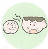
言葉で脅したり、脅迫すること

体罰は暴力でこどもの身体を傷つけるもので、心理的虐待は暴言などでこどもの心に深い傷を負わせるものです。こども本人への暴言でなくとも、配偶者や家族に対する強い言葉などもこどもの心を傷つけ、発達に影響する可能性があります。