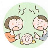
配偶者への暴力や暴言をこどもに見せること