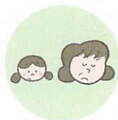
こどもを無視したり、拒否的な態度を示すこと