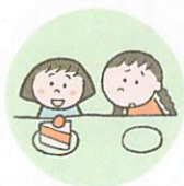
他のきょうだいは著しく差別的な扱いをすること