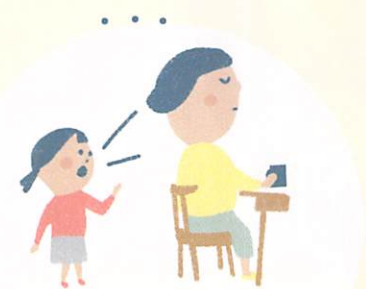
じ じ 無視される