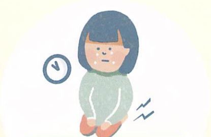
ちよう じ かん せい ざ 長時間の正座