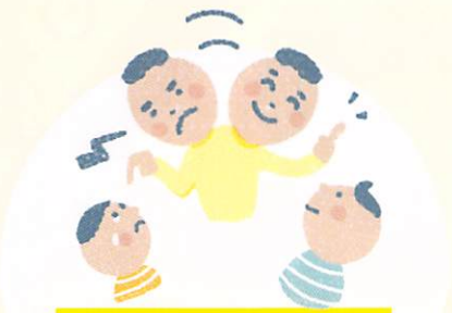
きよう だい と くら べ て け な す きょうだいと比べてけなす