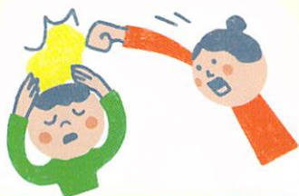
たたく・ける たたく ける