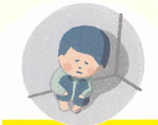
どこかに とじこめられる