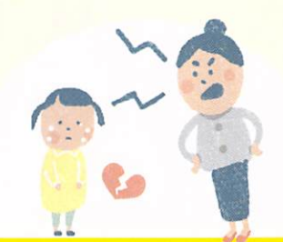
う ま れ て き た こ と を へ い じ さ れ る 産まれてきたことを否定される